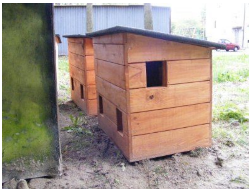
Przykładowe zdjęcie budki dla kotów

§ 16. 1. Urząd Gminy zapewni budki całoroczne, karmę w okresie zimowym społecznym opiekunom kotów wolno żyjących (karmicielom) na podstawie oświadczenia, w którym karmiciel oświadcza, że jest opiekunem kotów wolno żyjących, oraz że wyraża zgodę na przetwarzanie swoich danych osobowych dla potrzeb wynikających z realizacji Programu.